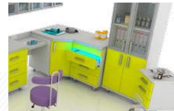
Бактерицидный модуль со встроенным блоком подогрева инструментов

Любой модуль ZERTS Winkelsatz может быть изменен или дополнен по Вашему заказу, а также подобран под размер и цвет любого помещения