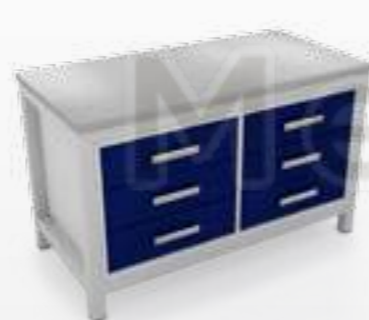
• Стол палатный 106-005-8