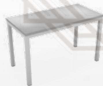
• Стол палатный 106-005-4