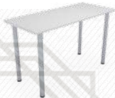
• Стол палатный 106-005-2