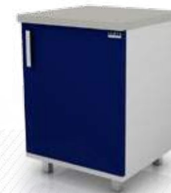
• Модуль с сейфом 102-003 С

Ширина Глубина Высота 650 мм 600 мм 850 мм