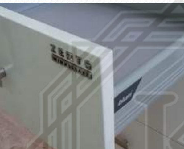
Система ТАНДЕМБОКС для выдвижных ящиков