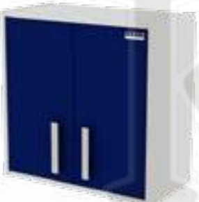
• Модуль подвесной (Глухие дверцы, вкладной тип фасада)