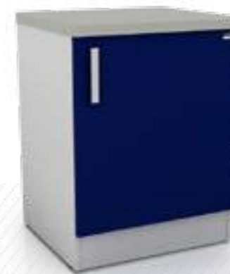
• Модуль с холодильным шкафом 102-003Х

Ширина Глубина Высота 850 мм 850 мм 850 мм