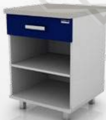
• Модуль для оборудования 102-003

Ширина Глубина Высота 600 мм 500 мм 850 мм