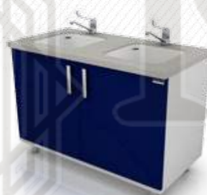
• Модуль прямой с 2-ной мойкой 102-002-2М

Ширина Глубина Высота 600 мм 600 мм 850 мм