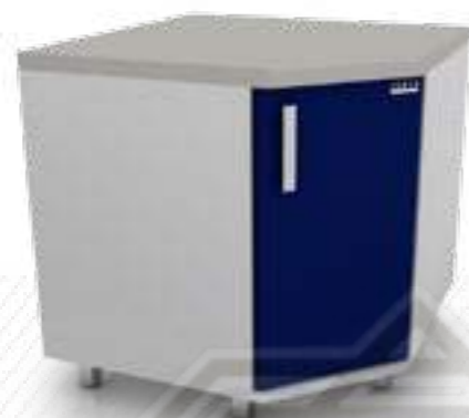
• Угловой модуль 102-001-У

Ширина Глубина Высота 850 мм 850 мм 850 мм