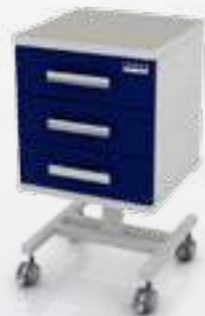
• Стол врача мобильный (ассистер) 103-001-З