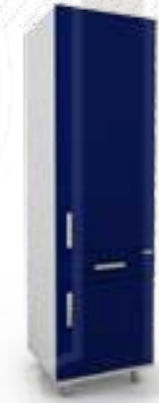
• Модуль шкаф (Верх глухой/низ ящик с полкой) 102-005-3