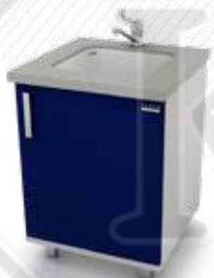
• Модуль прямой с мойкой 102-002-1М

Ширина Глубина Высота 600 мм 600 мм 850 мм