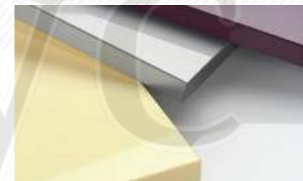
Фасады покрыты прочным глянцевым акриловым составом, стойким к дезинфекции. Более 50 цветов исполнения