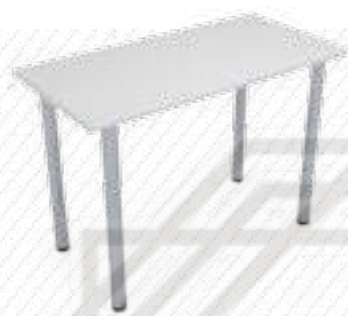
• Стол палатный 106-005-1