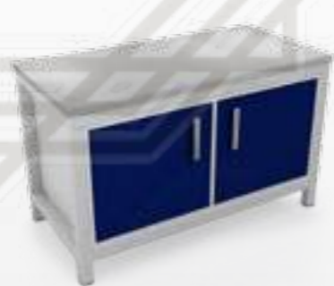
• Стол палатный 106-005-7