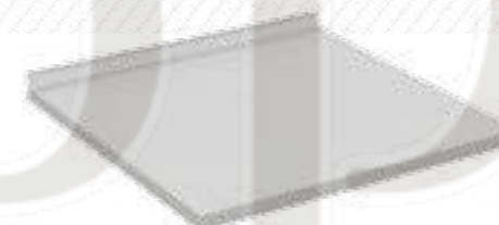
• Стол для врача для ассистера 102-004-А

Ширина Глубина Высота 1200 мм 600 мм 850 мм