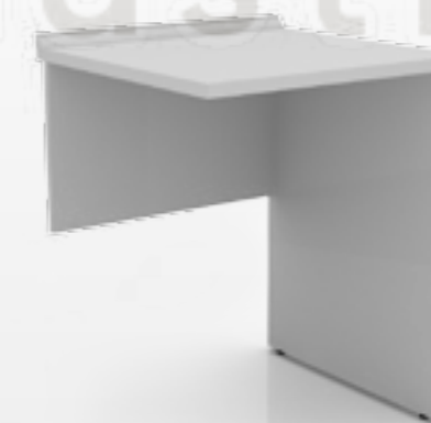
• Стол для врача для ассистера (на стоевых опорах) 102-004-АП

Ширина Глубина Высота 600 мм 600 мм 850 мм