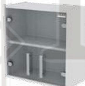
• Модуль подвесной (стекло, вкладной тип фасада)