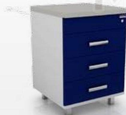
• Модуль бактерицидный 102-003Б

Ширина Глубина Высота 600 мм 600 мм 850 мм