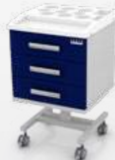
• Стол врача мобильный (ассистер) с пластиковой крышкой 103-001-ЗК