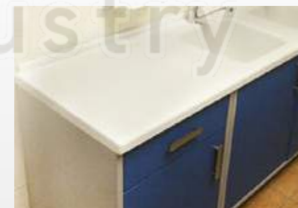
Единая бесшовная столешница с мойкой из акрилового камня, стойкого к химически активным веществам