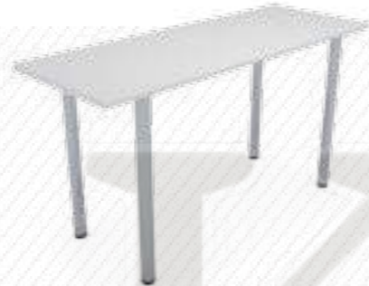
• Стол палатный 106-005-3