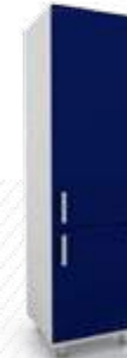
• Модуль шкаф (Верх/низ глухие дверцы) 102-005-1