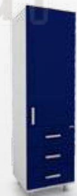
• Модуль шкаф (Верх глухой/низ 3 ящика) 102-005-5