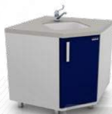
• Угловой модуль с мойкой 102-002-УМ

Ширина Глубина Высота 850 мм 850 мм 850 мм