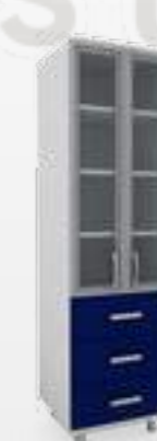
• Модуль шкаф (Верх стекло/низ 3 ящика) 102-005-6А