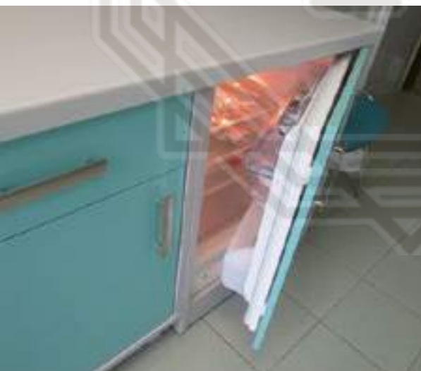
Возможность встроить холодильник