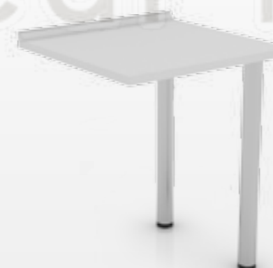
• Стол для врача для ассистера (на табулярных ногах) 102-004-АТ

Ширина Глубина Высота 600 мм 600 мм 850 мм