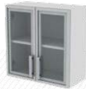
• Модуль подвесной (стекло, накладной тип фасада в алюминиевой рамке)