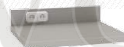
• Стол для микроскопа 102-004-М

Ширина Глубина Высота 600 мм 600 мм 850 мм