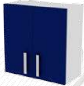
• Модуль подвесной (Глухие дверцы, накладной тип фасада)