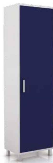
• шкаф для одежды

Ширина Глубина Высота 800 мм 600 мм 2100 мм