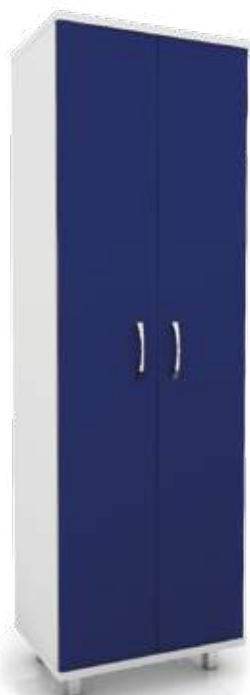
• шкаф для медикаментов

Ширина Глубина Высота 662 мм 475 мм 2100 мм