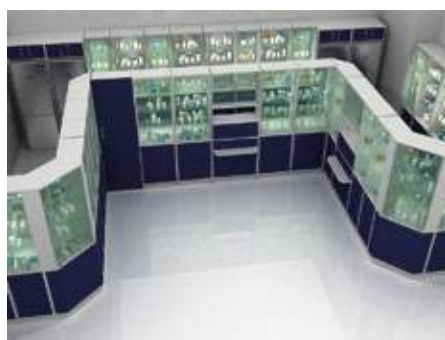
Мебель для аптек