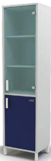
• шкаф для документов

Ширина Глубина Высота 662 мм 475 мм 2100 мм