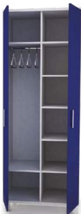
• шкаф для одежды

Ширина Глубина Высота 800 мм 400 мм 2100 мм