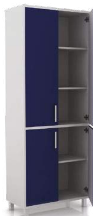
• шкаф для документов

Ширина Глубина Высота 450 мм 400 мм 2100 мм