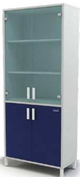
• шкаф для документов

Ширина Глубина Высота 800 мм 400 мм 2100 мм