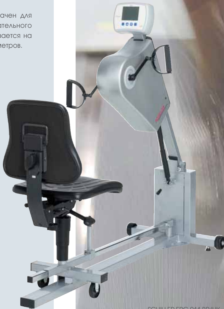
SCHILLER ERG 911 BP/НК

Новый ручной эргометр SCHILLER предназначен для пациентов с нарушениями опорно-двигательного аппарата. Эта специальная версия основывается на проверенных технологиях других наших эргометров.