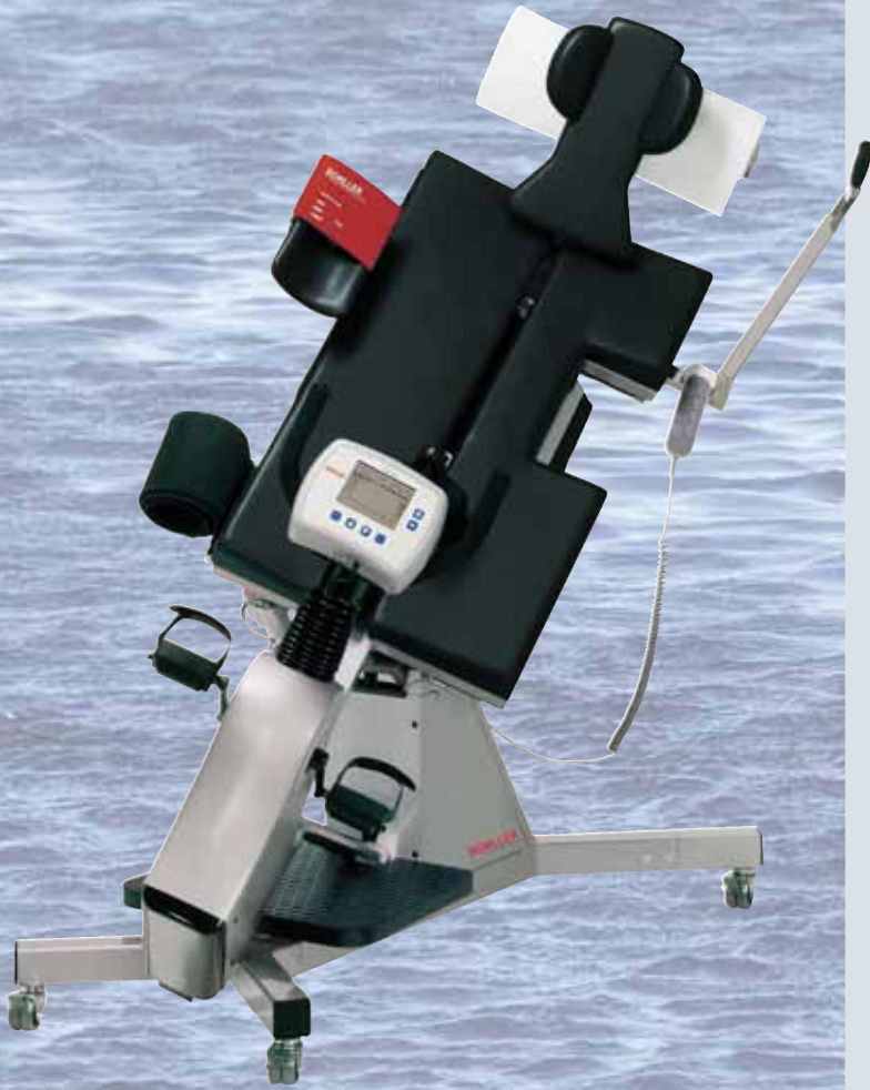
SCHILLER ERG 911 BP/LS

Использование этого эргометра также рекомендуется для проведения исследований у пожилых и физически ослабленных пациентов.