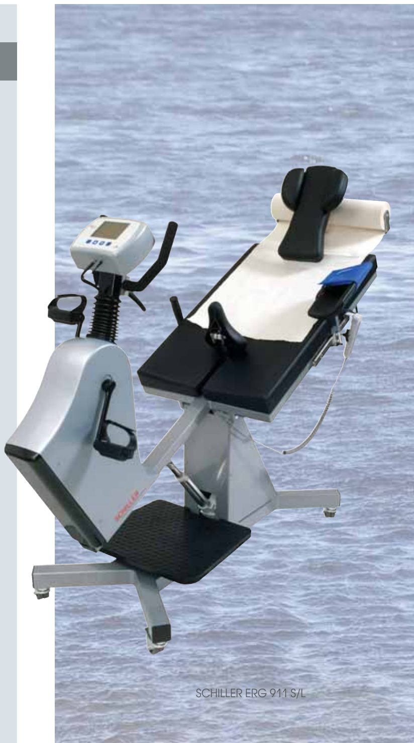
SCHILLER ERG 911 S/L

Он подходит для нагрузочного тестирования и тестирования с использованием катетера в кардиологии и восстановительной медицине, у пациентов группы риска, пожилых или физически ослабленных пациентов.