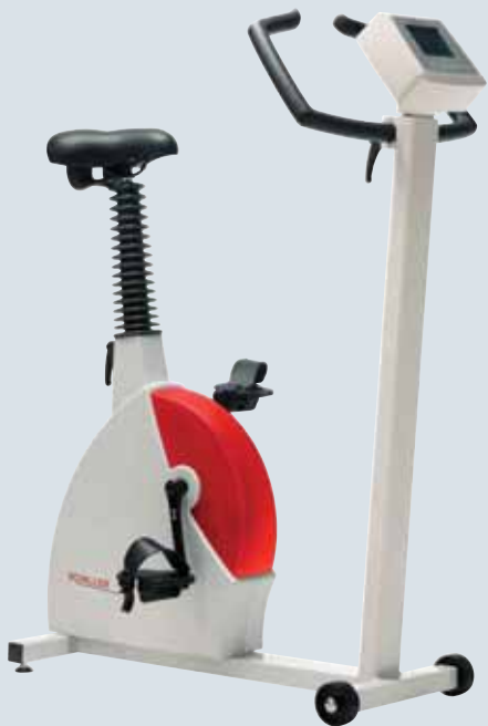
SCHILLER ERG 910S

Новые велоэргометры SCHILLER работают практически бесшумно, не требуют специального технического обслуживания и очень простые в эксплуатации.