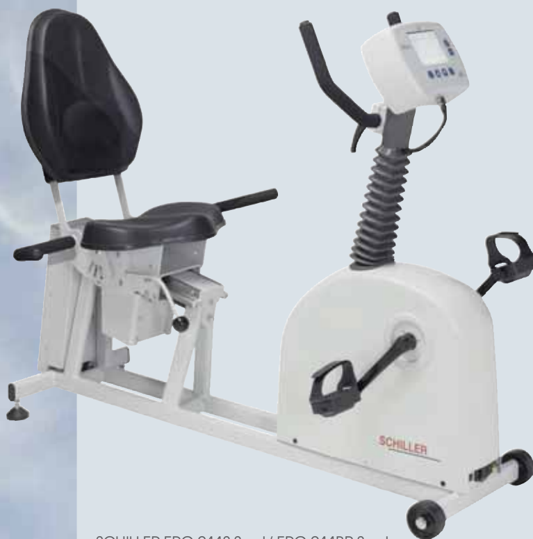
SCHILLER ERG 911S Seat/ ERG 911BP Seat

Сидячие эргометры SCHILLER для тестирования пациентов с большим весом