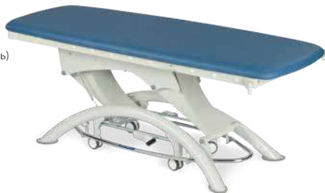
Смотровой стол Capre E1