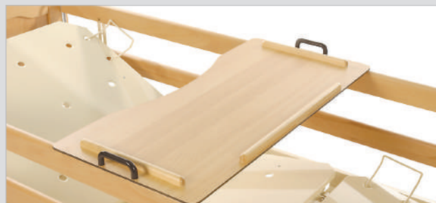
Столик для чтения и еды, размещение на боковых ограждениях