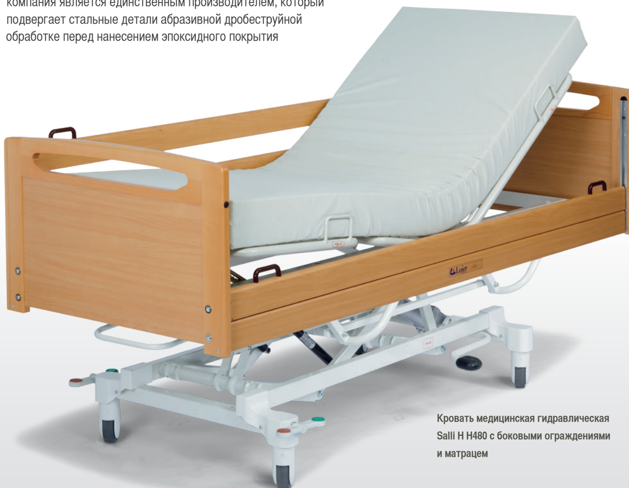
Кровать медицинская гидравлическая Salli H H480 с боковыми ограждениями и матрасом

“Серия надежных и функциональных гидравлических кроватей.”