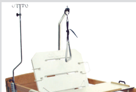
Дуга для активации пациента, инфузионная стойка, изогнутая