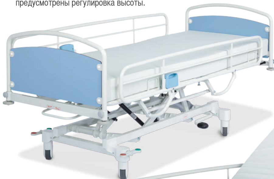
Кровать гидравлическая Salli H - 2 секции

“Простое и функциональное решение для ЛПУ”