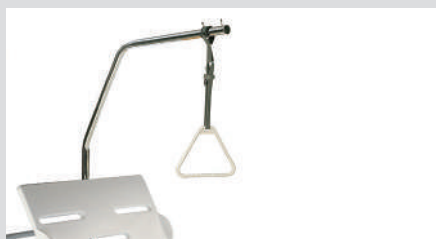
Дуга для активации пациента