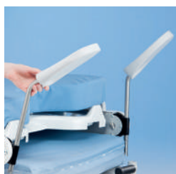
Опоры для ног A42559000