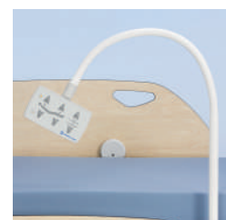
Панель управления для пациента и ночная подсветка (для 4-ех моторной модели) A43192000 (без лампы для чтения)