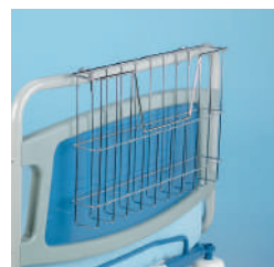
Корзина для журналов 128009784