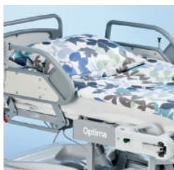
Боковые ограждения A42200100 для 4-ех моторной модели A42801000 для 2-ух моторной и гидравлической модели