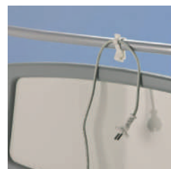
Держатель кабеля A41987307