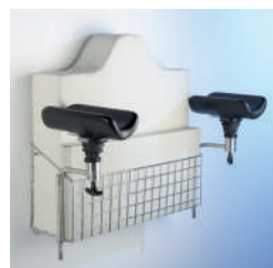
Корзина для хранения матрасов 100033974