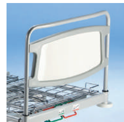
Торец стандартный 100009890 для 4-ех моторной модели 100009990 для 2-ух моторной и гидравлической модели