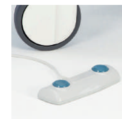
Ножная педаль A42965600 для 2-ух моторной модели