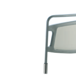
Наклоняемый торец A41935200 для 4-ех моторной модели A41982900 для 2-ух моторной и гидравлической модели