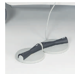
Ножная педаль A42471800 для 4-ех моторной модели