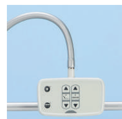
Панель управления для пациента, лампа для чтения, ночная подсветка (для 2-ух моторной модели) A42964800