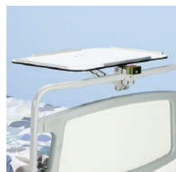
Стенд для монитора 128009769