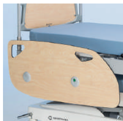
Боковые ограждения A42718200 для 4-ех моторной модели A42750700 для 2-ух моторной и гидравлической модели